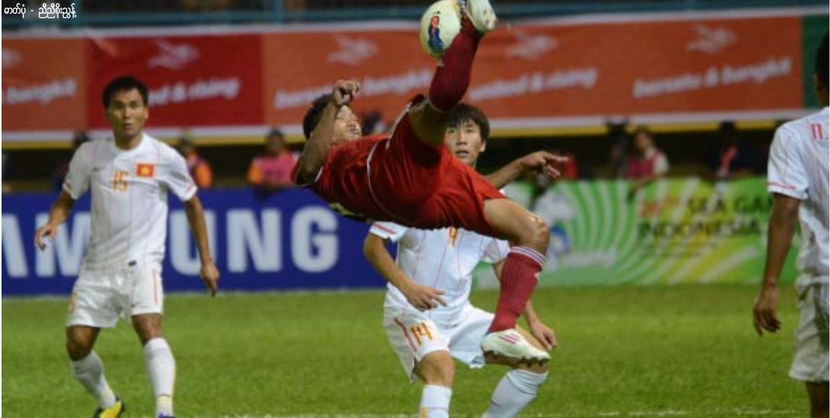
ပြီးခဲ့သည့် ၂၀၁၁ ဆီးဂိမ်းစ်ပြိုင်ပွဲ၌ မြန်မာနှင့်ဗီယက်နမ်တို့ တွေ့ဆုံခဲ့စဉ် (ယင်းပွဲတွင် ဂိုးမရှိသရေကျခဲ့သည်)

မြန်မာနိုင်ငံဘောလုံးအဖွဲ့ချုပ်(MFF)သည် ၂၀၁၃ ဆီးဂိမ်းစ်ပြိုင်ပွဲဝင်မည့် မြန်မာယူ-၂၃ အသင်းနှင့် ဗီယက်နမ်ယူ-၂၃ အသင်းတို့ခြေစမ်းကစားရန်အတွက် ဗီယက်နမ်ဘောလုံးအဖွဲ့ချုပ်(VFF)ထံသို့ဖိတ်ကြားခဲ့ရာ ယခုအခါ VFFက ဖိတ်ကြားမှုကို လက်ခံလိုက်ကြောင်း သိရသည်။ ထို့ကြောင့် မြန်မာယူ-၂၃အသင်းနှင့်ဗီယက်နမ်ယူ-၂၃ အသင်းတို့၏ခြေစမ်းပွဲကို လာမည့်အောက်တိုဘာ(၁၅)ရက်တွင် ရန်ကုန်မြို့ရှိ သုဝဏ္ဏကွင်း၌ ပြုလုပ်သွားမည်ဖြစ်ကြောင်း သိရသည်။ မြန်မာယူ-၂၃ အသင်း