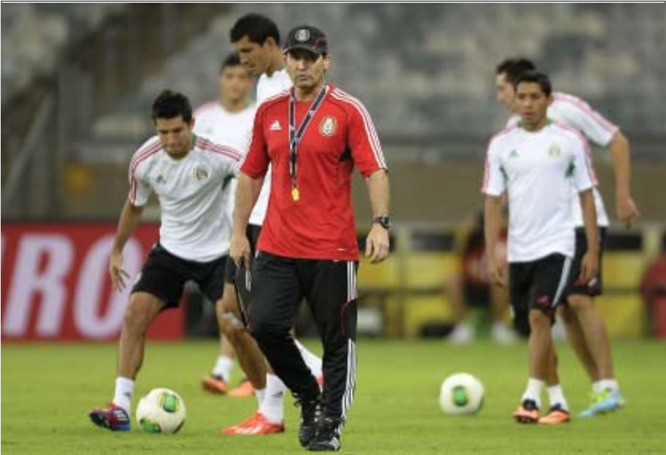
လေ့ကျင့်ရေးကွင်းမှ မက္ကဆီကိုနည်းပြ ဒယ်လာတော်ရေးနှင့်အသင်းသားများ

ကသာ အနိုင်ရခဲ့တာပါ။ ကျူးဘားရဲ့လက်ရှိခြေစွမ်းကလည်း အမေရိကန်ကို ဖျက်မြင်းလုပ်နိုင်စွမ်းမရှိပါဘူး။ ကလင်းစမန်းလက်ထက် ပထမဆုံးဖလားအတွက် အာရုံစိုက်နေတဲ့ အမေရိကန် ဂိုးပြတ်နိုင်ဖို့များပါတယ်။