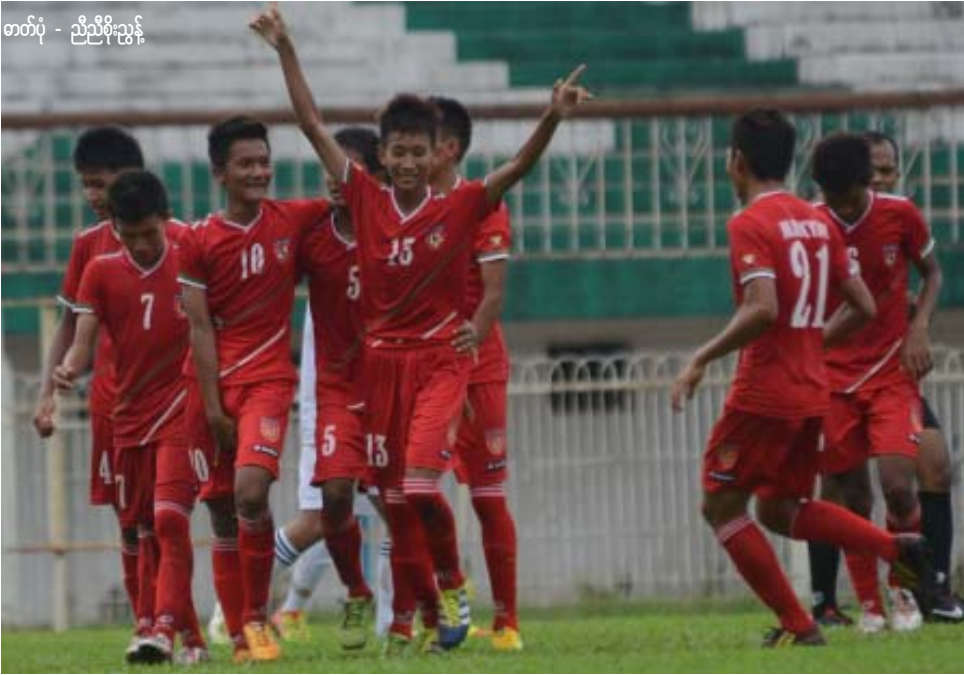
အာဆီယံလူငယ်(ယူ-၁၅)ဘောလုံးပြိုင်ပွဲဝင် မြန်မာယူ-၁၅ လူငယ်အသင်း

အာဆီယံလူငယ်(ယူ-၁၅)ချန်ပီယံရှပ် ဘောလုံးပြိုင်ပွဲ(FAM-FRENZ U15 ASEAN CHAMPIONS TROPHY 2013)ကို ဝင်