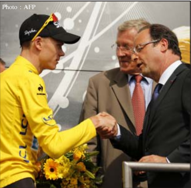
ပြင်သစ်သမ္မတဟော်လန်ဒီနှင့်တွေ့ဆုံခဲ့သည့် ခရစ္စဖရမ်း

ပြင်သစ်နိုင်ငံတွင်ကျင်းပလျက်ရှိသည့် ၂၀၁၃ Tour de France စက်ဘီးစီးပြိုင်ပွဲ ပွဲစဉ်(၁၀)အပြီးတွင် Sky အသင်းမှ ဗြိတိန်စက်ဘီးသမား ခရစ္စဖရမ်းက ဆက်လက်ဦးဆောင်လျက်ရှိနေကြောင်း AFPသတင်းများကဖော်ပြခဲ့သည်။ ခရစ္စဖရမ်းသည် ပွဲစဉ်(၁၀)တွင် အဆင့်(၂၄)နေရာဖြင့်သာ ပန်းဝင်ခဲ့သော်လည်း စံချိန်(၄၁)နာရီ၊ (၅၂)မိနစ်၊ (၄၃)စက္ကန့်ဖြင့် ဒုတိယနေရာမှ စပိန်စက်ဘီးသမား ဗယ်လ်ဗာဒီကို(၁)မိနစ်၊ (၂၅)စက္ကန့်ဖြင့် အသာရနေလျက်ရှိသည်။