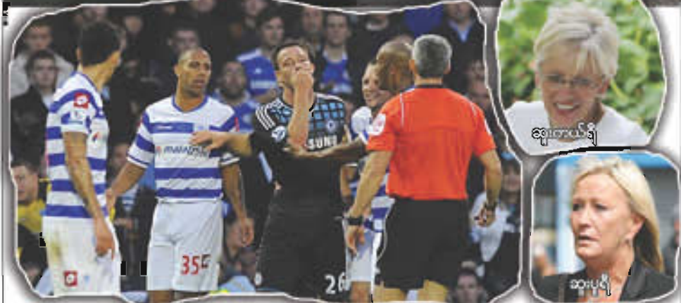
ချွေးတယ်ရီ