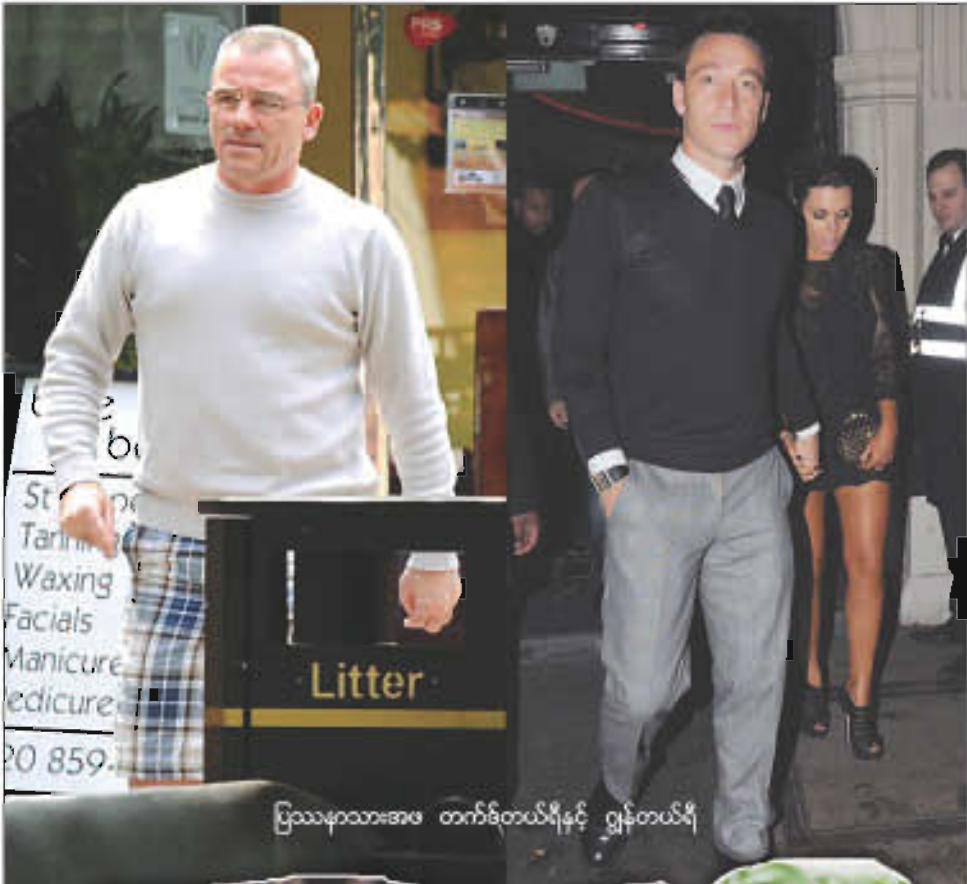
ပြဿနာသားအဖ တက်ဒ်တယ်ရီနှင့် ဂျွန်တယ်ရီ