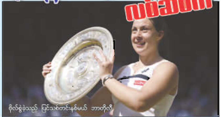
ဗိုလ်စွဲခဲ့သည့် ပြင်သစ်တင်းနစ်မယ် ဘာတိုလီ

ပြီးခဲ့တဲ့ ဝင်ဘယ်လ်အိတ်တင်းနစ်ပြိုင်ပွဲ ဗိုလ်လုပွဲမှာ ပြင်သစ်တင်းနစ်မယ် ဘာတိုလီက ရှုံးနိမ့်ခဲ့ရတဲ့ ဂျာမန်တင်းနစ်ကြယ်ပွင့်လစ်ဆစ်ကီ(၂၃ နှစ်)ဟာ တင်းနစ်မှာသာ ရှုံးနိမ့်ခဲ့ရတာမဟုတ်ဘဲ သူမရဲ့ အချစ်ရေးမှာလည်း ဆက်ပြီး ရှုံးနိမ့်ခဲ့ရတယ်လို့ဆိုရမှာပါ။ ဗိုလ်လုပွဲကစားစဉ်မှာ ပွဲကြည့်စင်ပေါ်ကနေ သူမကို စောင့်ကြည့်အားပေးနေသူတစ်ဦးရှိနေခဲ့ပါဘူး။ အရင်က သူမကစားတဲ့ပွဲတွေမှာ ဘင်ဂျမင်စတင်က(၂၆နှစ်)လိုခေါ်တဲ့ရေကူးသမားလေးတစ်ယောက်ကိုတွေ့ရလေ့ရှိပေမယ့်ဒီပွဲမှာတော့သူရောက်ရှိမလာခဲ့ပါဘူး။ မီဒီယာတွေကစစ်စစ်ခံခဲ့ရမှာတော့ ဘင်ဂျမင်စတင်ဟာ ဂျာမနီနိုင်ငံ၊ ဘာလင်မြို့မှာသာရှိနေပြီး သူ့အနေနဲ့ ဝင်ဘယ်လ်အိတ်တင်းနစ်ပြိုင်ပွဲကို သွားရောက်လိုတဲ့ ဆန္ဒမရှိကြောင်း၊ သူတို့နှစ်ဦးရဲ့ဇာတ်လမ်းပြီးဆုံးသွားပြီလို့ သူငယ်ချင်းတွေကိုအချိန်အမြဲကပ်စပ်ခဲ့ကြောင်း သိရပါတယ်။ ဂျာမန်တင်းနစ်မယ်တစ်ဦးဖြစ်တဲ့ လစ်ဆစ်ကီနဲ့ ဂျာမန်အိုလံပစ်ရေကူးသမားတစ်ဦးဖြစ်တဲ့ ဘင်ဂျမင်စတင်တို့ဟာ ၂၀၁၁ ခုနှစ်အတွင်းကဆုံဆည်းခဲ့ကြတာဖြစ်ပါတယ်။ နှစ်ဦးစလုံးအတိအကျအသိသိရရှိနေကြသို့