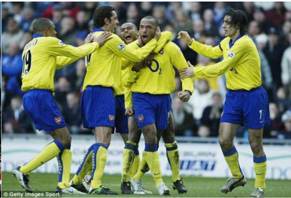
အာဆင်နယ်ကစားသမား(၆)ဦးက အသင်း၏ အိမ်ရိတ်စံကွင်းရှေ့တွင် အဝေးကွင်းဝတ်စုံ ဝတ်ဆင်ပြသနေစဉ် ၂၀၀၃-၀၄ ရာသီက ရုံးပွဲမရှိခဲ့သည့် အာဆင်နယ်အသင်း

အာဆင်နယ်အသင်းသည် လာမည့် ၂၀၁၃-၁၄ရာသီ၌အဝေးကွင်းအကူအဖြစ် အဝါရောင်အကူအညီကို ဝတ်ဆင်သွားမည်ဖြစ်ကြောင်း သိရသည်။ အိမ်ကွင်းအကူအညီ ပြောင်းလဲခြင်းမရှိသော်လည်း ပြီးခဲ့သည့်ရာသီကဝတ်ဆင်ခဲ့သော ခရမ်းရောင်အဝေးကွင်းဝတ်စုံကိုပြန်လည်ပြင်ဆင်ခဲ့ခြင်းဖြစ်သည်။အာဆင်နယ်အသင်းသည် ၂၀၀၃-၀၄ဘောလုံးရာသီက ပရီးမီးယားလိဂ်ပြိုင်ပွဲတွင် တစ်ရာသီလုံး ရှုံးပွဲမရှိခဲ့ဘဲ ချန်ပီယံအဖြစ် ဗိုလ်စွဲခဲ့စဉ်ကအဝါရောင်အဝေးကွင်းအကူအညီဝတ်စုံကိုဝတ်ဆင်ခဲ့သည်။ အာဆင်နယ်အသင်းသည်၁၉၉၆-၉၇ ဘောလုံးရာသီကလည်း အဝါ