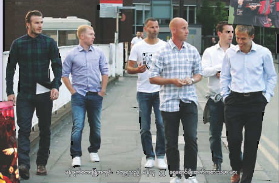
မန်ချက်စတာမြို့တွင်း တွေ့ရသည့် မန်ယူ ၉၂ ရွှေရောင်မျိုးဆက်ကစားသမားများ

ဒီကစားသမား(၆)ဦးဟာ စားသောက်ဆိုင်မှာ စားသောက်ပြီးတဲ့အခါမှာတော့ မန်ယူအသင်းရဲ့ အမှတ်တရပစ္စည်းရောင်းတဲ့ဆိုင်ကိုရောက်ရှိလာခဲ့ပြီး ပရီသတ်တွေရဲ့အမှတ်တရဓါတ်ပုံရိုက်ခံခဲ့သလို၊ ပစ္စည်းတချို့ဝယ်ယူအားပေးခဲ့ကြောင်း သိရှိရပါတယ်။ ဝယ်ယူတဲ့ပစ္စည်းတွေထဲမှာ ဘက်ခမ်က ထူးထူးခြားခြား လာမယ်ရာသီ မန်ယူအသင်းဝတ်ဆင်မယ့် အိမ်ကွင်းအင်္ကျီအသစ်တစ်ထည်ကို အားပေးသွားခဲ့ကြောင်း သိရှိရပါတယ်။