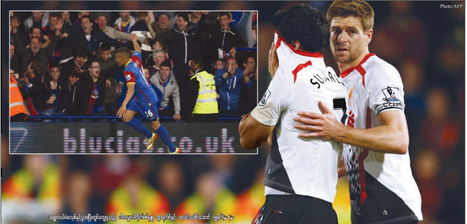
သရေသာပဲလေစ်နှင့်ပွဲအပြီးတွင်ထူရသည့် လီဗာပူးလ်တို့၏ပျော်ရွှင်မှုနှင့် အသင်းခေါင်းဆောင် ဂျာနီ >

ဆွာရက်ကိုယူ အားမနာ ဒီရာသီမှာ လီဗာပူးလ်ချန်ပီယံလမ်းကြောင်း ပေါ်ရောက်ဖို့ အကောင်းဆုံးစွမ်းဆောင်ခဲ့သူက ဆွာရက်ကိုယူ ဖြစ်သွားမည်။ အသင်းက ထွက်မလို ဖြစ်ခဲ့ပေမယ့် ဆက်နေဖို့ဆုံးဖြတ်ချိန်မှာလည်း ပရီမီယာ ကိုယ့်အလုပ်ကိုယ်အကောင်းဆုံး လုပ်ပြခဲ့သည်။ သွင်းလိုက်ရသည့် ဂိုးတွေက တစ်ခါတည်း စီရော်နယ်လ်ဒို၊ မက်ဆီတို့နှင့် နှိုင်းယှဉ်လျှင် ခြေစွမ်းပြခဲ့သူလည်းဖြစ်သည်။ လီဗာပူးလ်အတွက် ရာသီအစမှစ၍ အဆုံးအထိ တာဝန်ကျခဲ့သူလည်းဖြစ်သည်။ ဒါပေမဲ့ ပဲလေစ်ကို သရေသာပြန်သည့်နောက်မှာတော့ လီဗာပူးလ်ရဲ့ အိမ်မက်တွေဝေဝါးကုန်သည်။ တကယ်ဆို ဒီလောက်အရေးပါသည့်အချိန်မှာ အရေးပါသည့် ဂိုးတွေ အများကြီးရထားပြီးမှ နောက်ဆုံး(၁၀) မိနစ်ကျော်လောက်ကို မထိန်းနိုင်ဘဲ သရေသာသွားခြင်းက လက်ခံနိုင်စရာမရှိ။ တိုက်စစ်က တာဝန်ကျသလောက် လီဗာပူးလ်ခံစားရ ပေါ့လျော့လွန်းသည်။ အခုတော့ ချန်ပီယံအိမ်မက်လည်း မှုန်ပါ။ သမိုင်းတွင်မယ့်အမာရွတ်တစ်ခုလည်း ကျန်ရစ်။ ၂၀၀၅ ခုနှစ်ပီယံလိဂ်ပွဲမှာ အေစီမီလန် ခံစားခဲ့ရတာကို လီဗာပူးလ်လည်း ကြုံဖူးသွားပြီဖြစ်သည်။ တကယ်တော့ ချယ်လ်ဆီးနှင့် လီဗာပူးလ်တို့က အစွန်းနှစ်ဖက်မှာ ရှိခဲ့ကြသည်။ တစ်သင်းက အကောင်းဆုံးခံစားရ ချီးမွမ်းသည့်တိုက်စစ်၊ တစ်သင်းက အကောင်းဆုံးတိုက်စစ်နှင့် စိတ်ပျက်ဖွယ်ခံစားရတိုက်ပိုင်ဆိုင်ခဲ့ကြသည်။ နောက်ဆုံးတော့ ခံစားရ တိုက်စစ် ပိုမိုဟန်ချက်ညီသည့် မန်စီးစီးက အလားအလာကောင်းသွားခဲ့သည်။ လီဗာပူးလ်ရဲ့ နောက်ပိုင်းပွဲရလဒ်တွေက သိပ်တော့မဟုတ်တော့။ အဆုံးအဖြတ်ကာလတွေမှာ လီဗာပူးလ်ရဲ့ အနိုင်ရလဒ်တွေက ပြတ်ပြတ်သားသားမရှိ။ အပြန်အလှန်သွင်းဂိုးတွေနဲ့ ပွတ်ကာသိကာနိုင်နေခြင်းဖြစ်သည်။ နောက်