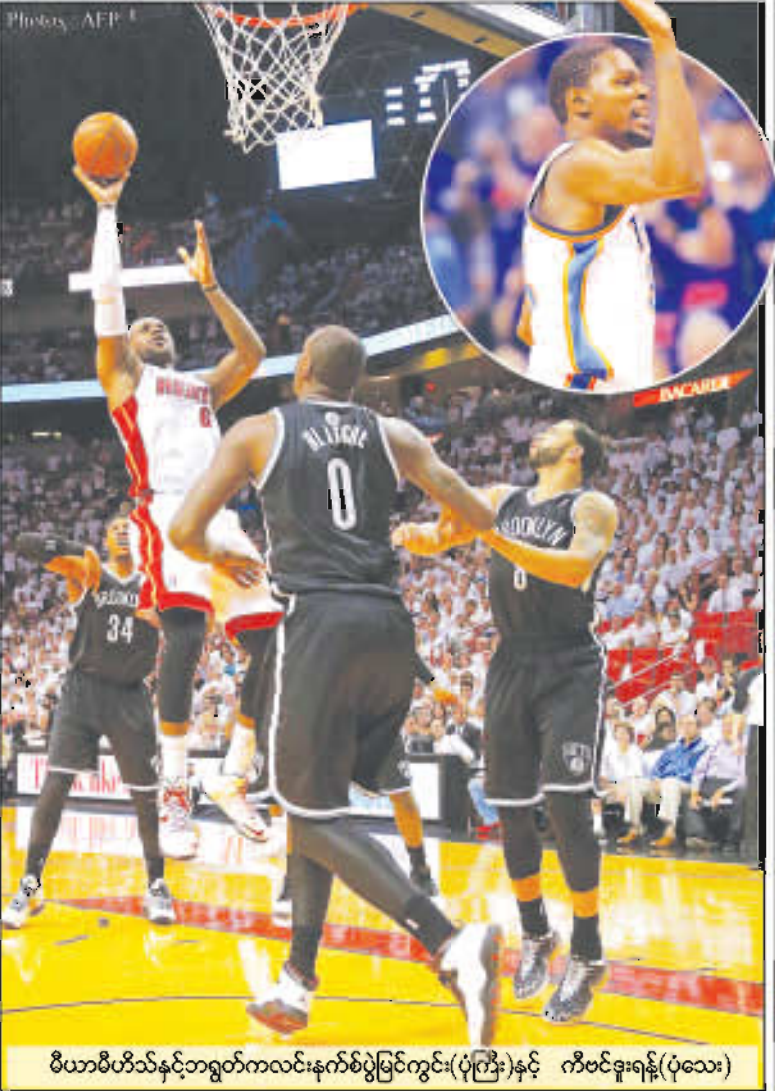
မီယာမီဟိတ်နှင့်ဘရူကလင်းနက်စ်ပွဲမြင်ကွင်း(ပုံကြီး)နှင့် ကီဗင်ဒူးရန်(ပုံသေး)

နှင့်ဆောင်ပေါ်ရေးသူများ ရပ်သံလွှင့်သမား များမှရွေးချယ်ခဲ့ခြင်းဖြစ်ပြီး ကီဗင်ဒူးရန်ဆွတ် ရမှတ်ပေါင်း (၁၂၃၂)မှတ်ဖြင့် ရမှတ်အများ ဆုံးရရှိခဲ့ခြင်းဖြစ်သည်။ ကီဗင်ဒူးရန်ဆွတ် ယင်းဆုကို ပထမဆုံးအကြိမ် ဆွတ်ခူးရရှိ ခြင်းဖြစ်ပြီး ပုံမှန်ရာသီအတွင်း ၎င်း၏ကစား သမားသက်တမ်းတစ်လျှောက် အကောင်း ဆုံးစွမ်းဆောင်မှုအဖြစ် တစ်ပွဲပျမ်းမျှ (၃၂) မှတ်အထိရယူခဲ့ပေးသည်။ MVP ဆုကို နောက်ဆုံး(၅)နှစ်အတွင်း (၄)ကြိမ်ရရှိထား ခဲ့သည့် လီဘာရှင်ဂျီမစ်မှာ (၈၉၁)မှတ်ဖြင့် ဒုတိယနေရာသာ ရရှိခဲ့သည်။