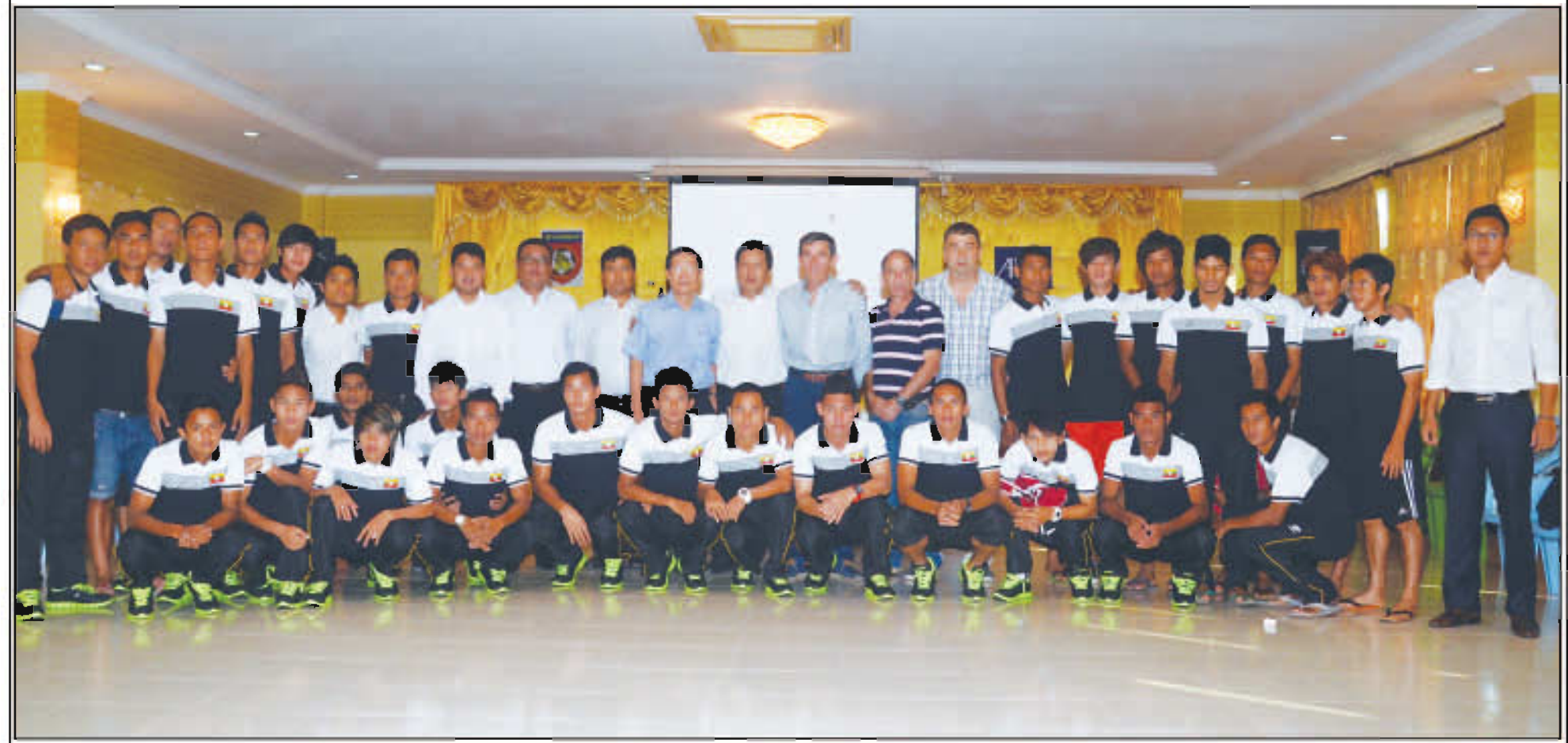
ပထမမြန်မာ့လက်ရွေးစင်အသင်းအား ထိုင်းနိုင်ငံခြေစမ်းခရီးစဉ်မတိုင်မီ တွေ့ရစဉ်

AFC Challenge Cup ပြိုင်ပွဲကို ဝင်ရောက်ယှဉ်ပြိုင်မည့် မြန်မာ့လက်ရွေးစင်အသင်းသည် ပြီးခဲ့သည့် မေ(၇)ရက်က ထိုင်းနိုင်ငံသို့သွားရောက်ခဲ့ပြီး နေထိုင်လေ့ကျင့်နေလျက်ရှိကာ ခြေစမ်းပွဲများကစားသွားမည်ဖြစ်ကြောင်း သိရသည်။ မြန်မာ့လက်ရွေးစင်အသင်းသည် ထိုင်းနိုင်ငံခရီးစဉ်အတွင်း၌ ထိုင်းလက်ရွေးစင်အသင်းအပါအဝင် ခြေစမ်းပွဲ(၂)ပွဲကစားရန်စီစဉ်ထားကြောင်း သိရသည်။ မြန်မာ့လက်ရွေးစင်အသင်းသည် လာမည့် မေ(၁၂)ရက်တွင် ထိုင်းပရီမီးယားလိဂ်ကလပ်အသင်းတစ်သင်းနှင့်လည်းကောင်း၊ မေ(၁၄)ရက်တွင် ထိုင်းလက်ရွေးစင်အသင်း