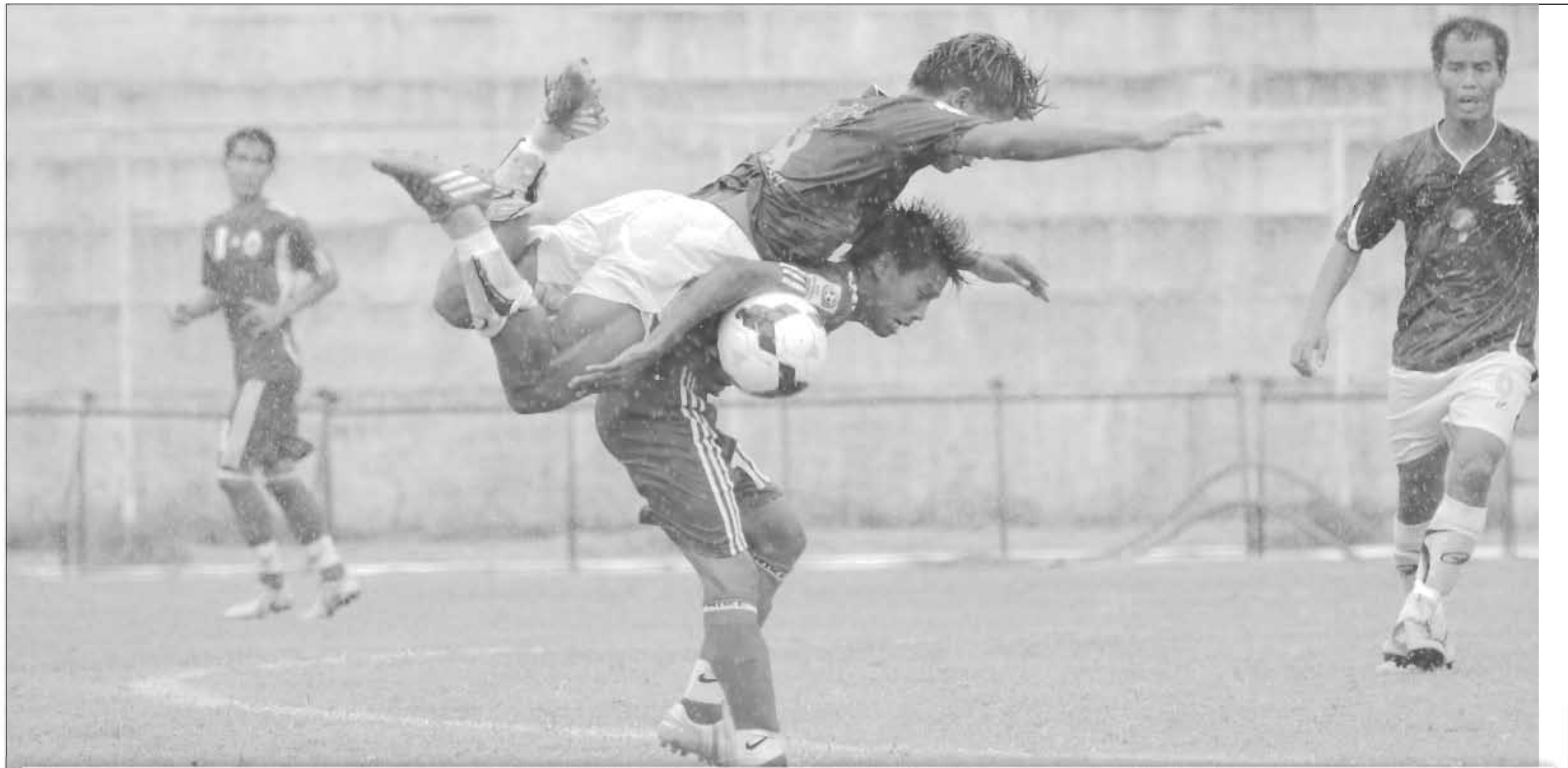
Southern အသင်းနှင့် ရခိုင်ယူနိုက်တက်အသင်းတို့ အကြိတ်အနယ်ယှဉ်ပြိုင်နေစဉ်