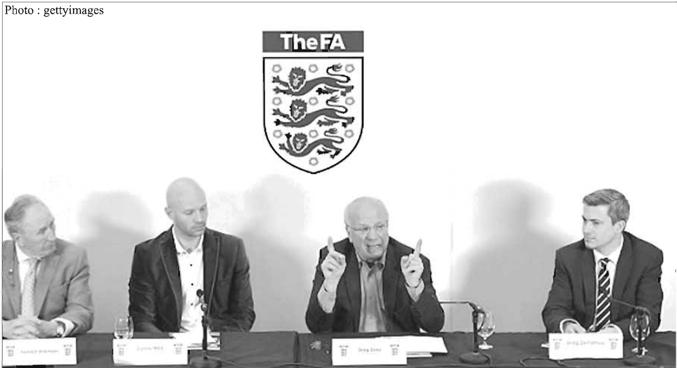
FA၏စီမံကိန်းများနှင့်ပတ်သက်၍ ဥက္ကဋ္ဌဂရက်ဒိုက် ရှင်းလင်းပြောကြားနေစဉ်

အတွက် ပြီးခဲ့သည့်နှစ်အောက်တိုဘာလက တည်းက FA ဥက္ကဋ္ဌဂရက်ဒိုက်နှင့် အင်္ဂလန်လက်ရွေးစင်အသင်းနည်းပြ ရွှင်းဟော့ဒ်ဆန် အပါအဝင် ပုဂ္ဂိုလ်(၁၀)ဦးဖြင့် အထူးကော်မရှင် တစ်ခုဖွဲ့စည်းကာ အပြောင်းအလဲများပြုလုပ်ရန် စတင်ဆောင်ရွက်နေခြင်းဖြစ်သည်။ ယခုအခါ အဆိုပါကော်မရှင်က ၎င်းတို့၏စီမံကိန်းများကို ချပြခဲ့ခြင်းဖြစ်ပြီး ပရီးမီးယားလိဂ်၌ အင်္ဂလန်