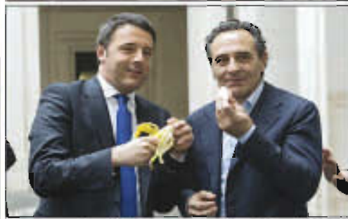
လူမျိုးရေးခွဲခြားမှုကို ဆန့်ကျင်သည့်အနေဖြင့် ဘောလုံးလောကမှ နာမည်ကျော်ကစားသမားများက ငှက်ပျောသီးများ စားပြနေစဉ်