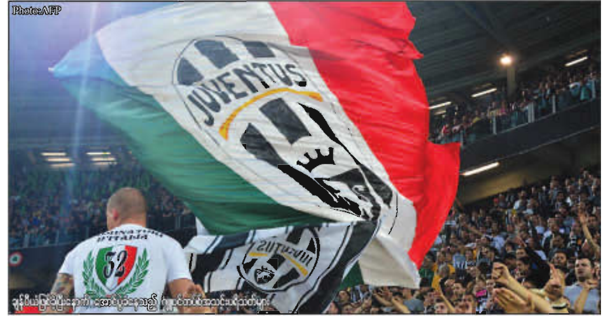
ချန်ပီယံပြုပြီးနောက် အောင်ပွဲခံနေသည့် ဂျူဗင်တပ်စ်အသင်းမိုသတ်မှာ

ခံချက် နိုင်သည့်ပွဲကြည့်ရင် လီဗာပူးလ်ရဲ့ နောက်ခံအတွင်းလူ (၂)ဦးဖြစ်သည့် စကာတယ်လ်နှင့် ဆာဒီတို့ရဲ့ ခေါင်းဆောင်မှုစွမ်းရည်ကင်းမဲ့မှုကို တွေ့နိုင်သည်။ လူ့ကပ်စ်ဇာဏ်ရာကပြန်သက်သာလာချိန်မှာ ဘရန်ဒန်ရော့ကဲ့ရဲ့ အသင်းက တစ်ရာသီလုံးမှာ ခြေစွမ်းအဆုံးဆုံးကာလတွေဖြစ်သွားတာကိုလည်းတွေ့ရသည်။ စကာတယ်လ်နှင့် ဆာဒီတို့က ကစားသမားကောင်းတွေဖြစ်နိုင်ပါသည်။ ဒါပေမဲ့ ဦးဆောင်နိုင်သူတွေတော့မဟုတ်။ တစ်ဦးနှင့်တစ်ဦးလည်း လုံလောက်တဲ့ Communicate မရှိ။ တစ်ဦးဟာကွက်ကို တစ်ဦးမဖြည့်ပေးနိုင်။ ဒီလိုနဲ့ အကောင်းဆုံးတိုက်စစ်လည်း အောင်မြင်မှုအတွက် အာမခံချက်မပေးနိုင်တော့။ လီဗာပူးလ်ခံစားရတော့ ဆွာရက်ကိုယူ အားမနာဟုဆိုချင်သည်။ နယ်တို့ နည်းပြ ဂစ် နည်းပြအပြောင်းအလဲတွေလုပ်ချင်ပြီဆို