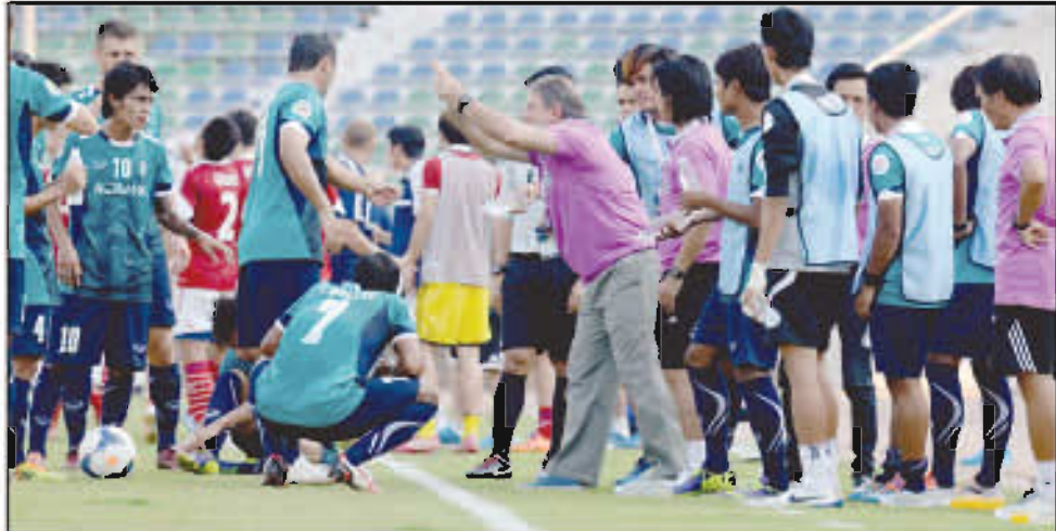
ရန်ကုန်ယူနိုက်တက်အသင်း နည်းပြချုပ်နှင့်ကစားသမားများကို တွေ့ရစဉ်

၂၀၁၄ AFC Cup ဖြိုင်ပွဲ ရုံးထွက်(၁၆)သင်းအဆင့်သို့ရောက်ရှိနေသည့် မြန်မာ့ကန်တန်ဖူ ရန်ကုန်ယူနိုက်တက်အသင်းမှာ လာမည့် မေ(၁၃)ရက်တွင် အင်ဒိုနီးရှားနိုင်ငံသို့သွားရောက်၍ ပါဗီယူရာရောက် ယှဉ်ပြိုင်ကစားရမည်ဖြစ်ကြောင်း သိရသည်။ ရန်ကုန်ယူနိုက်တက်အသင်းမှာ လာမည့် မေ(၁၃)ရက်တွင် အင်ဒိုနီးရှားနိုင်ငံသို့သွားရောက်၍ ပါဗီယူရာရောက် ယှဉ်ပြိုင်ကစားရမည်ဖြစ်ကြောင်း သိရသည်။