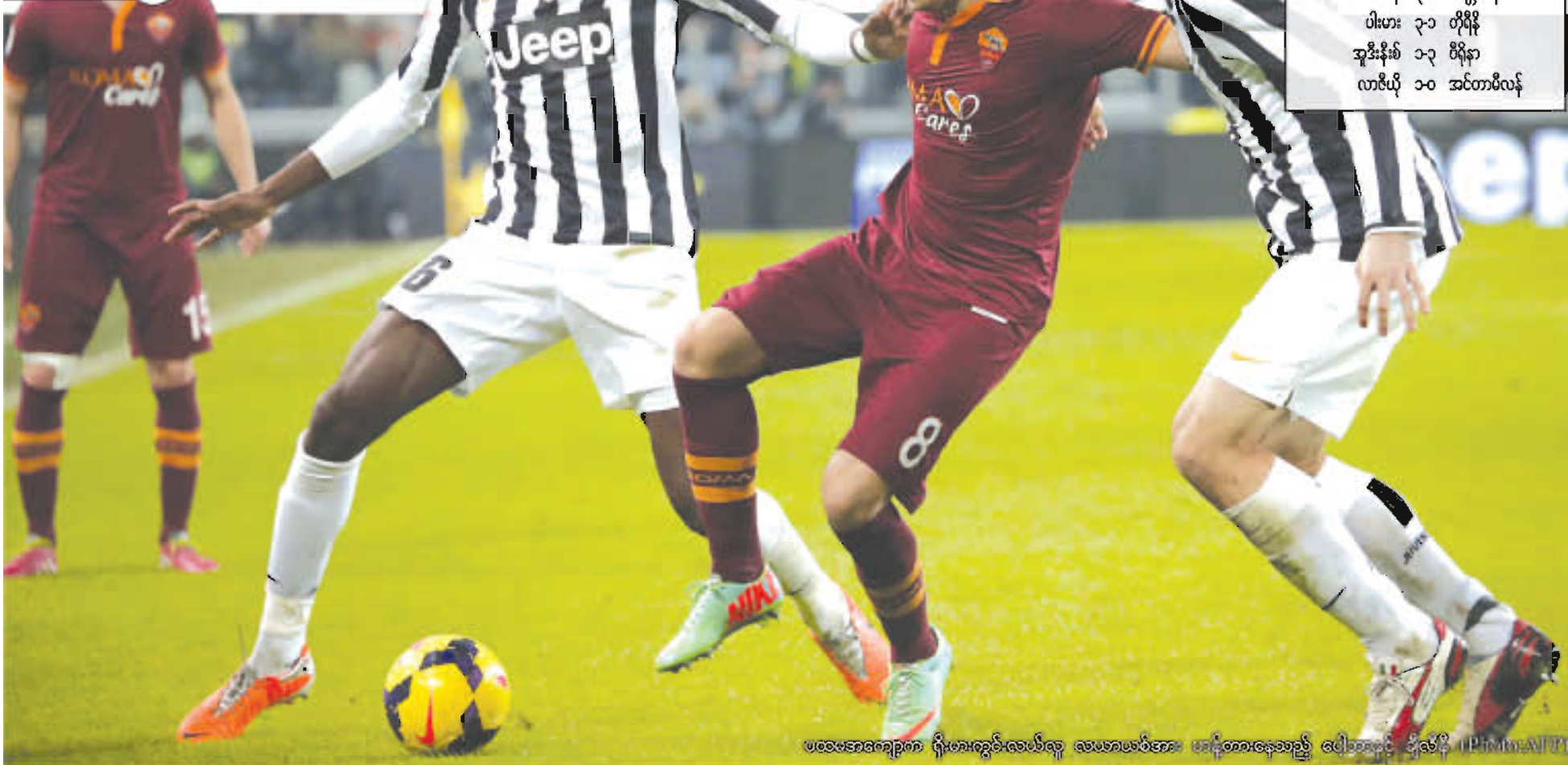
ပထမအကျော့ရလဒ်များ ရိုးမားကွင်းလယ်လူ လေယာယစ်အား မာနိုတားနေသည့် ပေါ့တာနို ချီယော့ (PIMMATT)