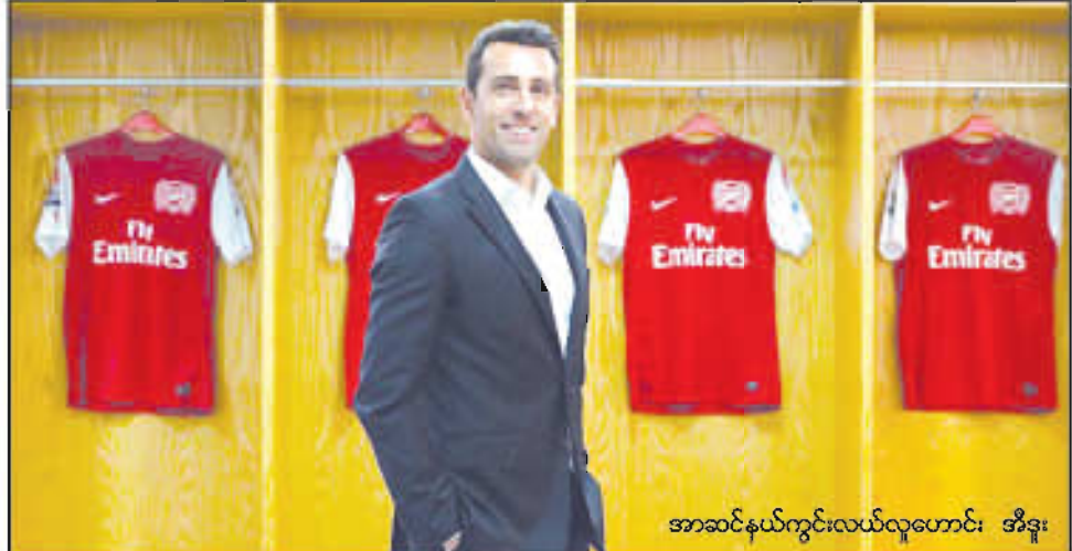
အာဆင်နယ်ကွင်းလယ်လူဟောင်း အီဒူး