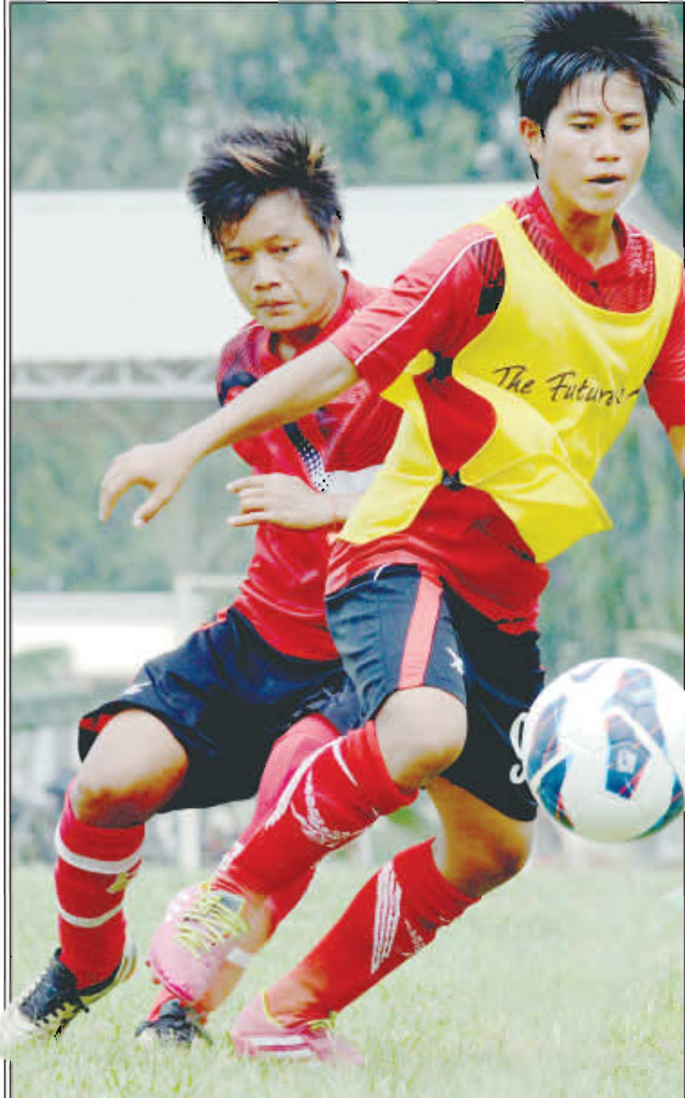
လေ့ကျင့်ရေးကွင်းတွင်တွေ့ရသည့် မြန်မာအမျိုးသမီးကစားသမားများ (ဓာတ်ပုံ-ညီညီစိုးညွန့်)

၂၀၁၄ အာရှဖလားအမျိုးသမီးဘောလုံးပြိုင်ပွဲ(2014 AFC Women's Asian Cup)ကို ဝင်ရောက်ယှဉ်ပြိုင်မည့် မြန်မာအမျိုးသမီးလက်ရွေးစင်အသင်းသည် တရုတ်နိုင်ငံသို့သွားရောက်၍ နေပြည်တော်ကွင်းတွင် ခြေစမ်းပွဲများယှဉ်ပြိုင်ကစားခဲ့ပြီးနောက် ယခုအခါ အပြီးသတ်ကစားသမား(၂၃)ဦးကို ရွေးချယ်လိုက်ပြီဖြစ်ကြောင်း သိရသည်။