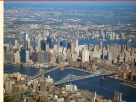
حي الأعمال بمنهاتن (نيويورك)

تخصّص المركز: تراجع الوظائف السكنية والصناعية لمراكز المدن الكبرى وتخصّصها في الوظائف الإدارية والمالية والخدمات الراقية الأخرى. تخصّص الأطراف: تدعيم الوظائف السكنية والصناعية والتجارية