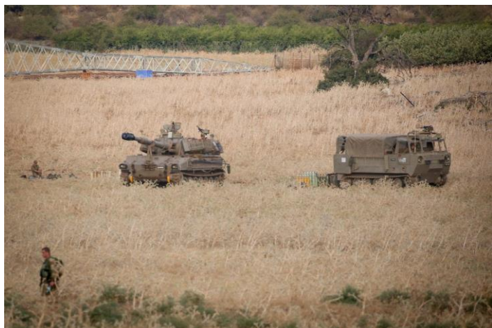
تجهیزات نظامی اسرائیلی در بلندی های جولان اشغالی

https://hamodia.com/2020/07/31/gantz-instructs-idf-bomb-lebanese-infrastructure-hezbollah-harms-soldiers-civilians/