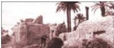
قرية جيكور في العراق