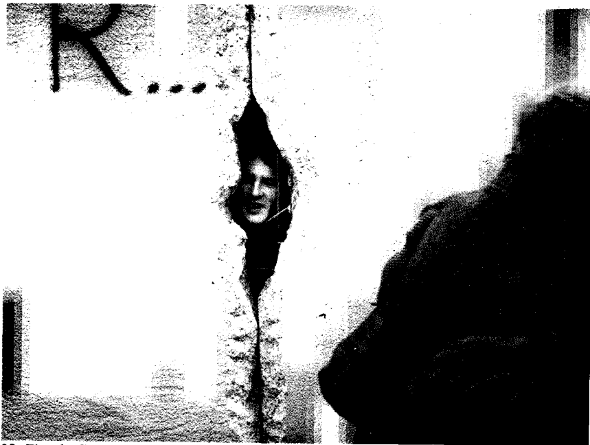
32. Fim da Guerra Fria: cai o Muro de Berlim, 1989.