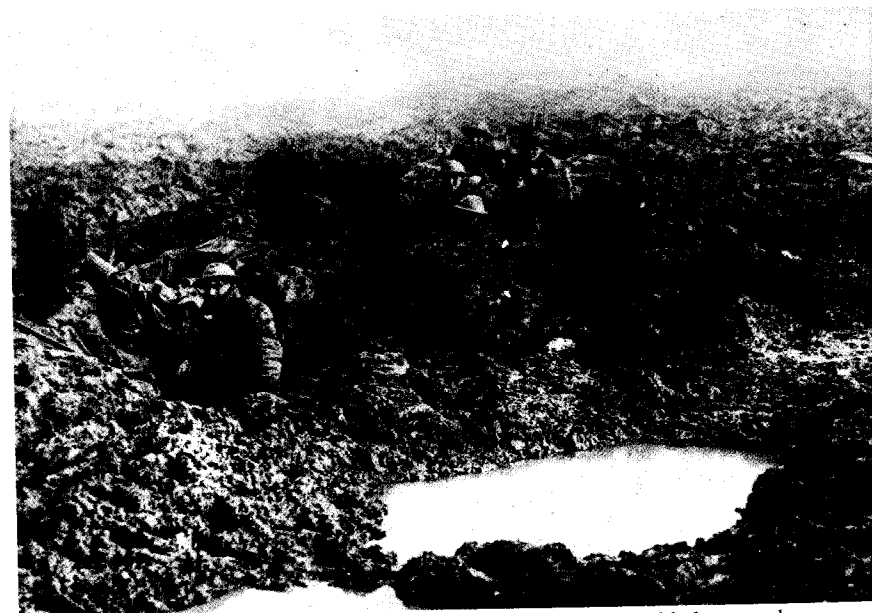
2. Os campos de massacre da França, vistos pelos agonizantes: soldados canadenses em crateras de granadas, 1918.