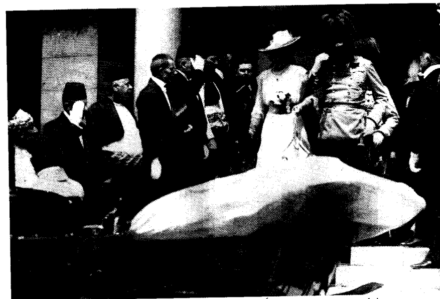
1. Sarajevo: o arquiduque Francisco Ferdinando da Áustria e sua esposa deixam o Paço Municipal de Sarajevo, a caminho de seu assassinato, que provocou a Primeira Guerra Mundial (28 de junho de 1914).

Por outro lado, eram ocidentais as ideologias, os programas, mesmo os métodos e formas de organização política que inspiraram a emancipação dos países dependentes e atrasados de sua dependência e atraso: liberais; socialistas; comunistas e/ou nacionalistas; secularistas e desconfiados do clericalismo; e fazendo uso dos mecanismos desenvolvidos para os fins da vida pública